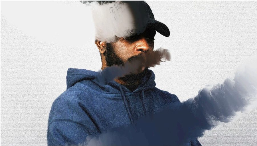
Press Shot 1 by Kay Ibrahim.jpg