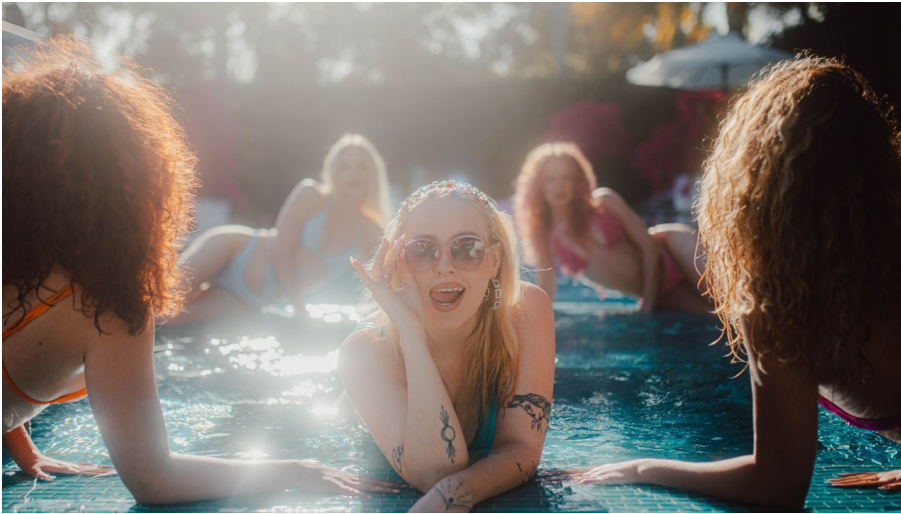
ASDIS_Pressebild3.jpg - © Stefanie Ganschow