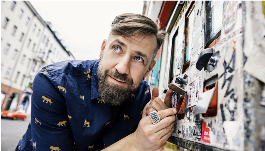
1920x1080 GNZ_6978_credits_Chris Gonz.png