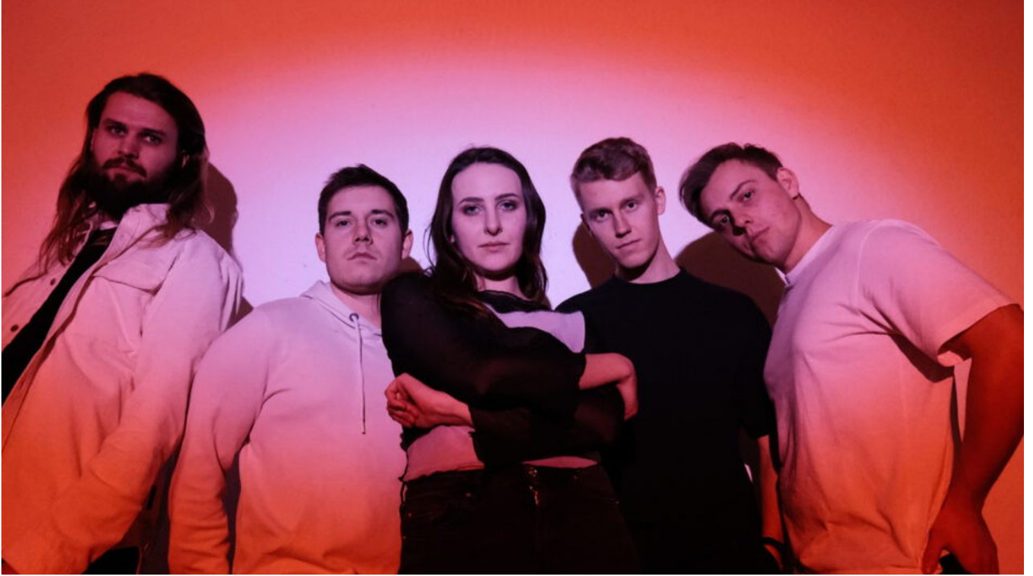
Titelbild-Give-me-a-remedy - © Give Me A Remedy

Quelle: destination.one ID: e_100859497 Zuletzt geändert am 17.06.2024, 06:11