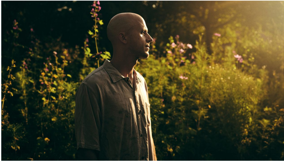
Milow_Credit Charlie De Keersmaecker.jpg