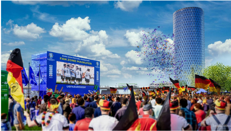
Frankfurt_Fan Zone Mainufer Big Screen und Fans_© Brandmission.jpg - © Brandmission