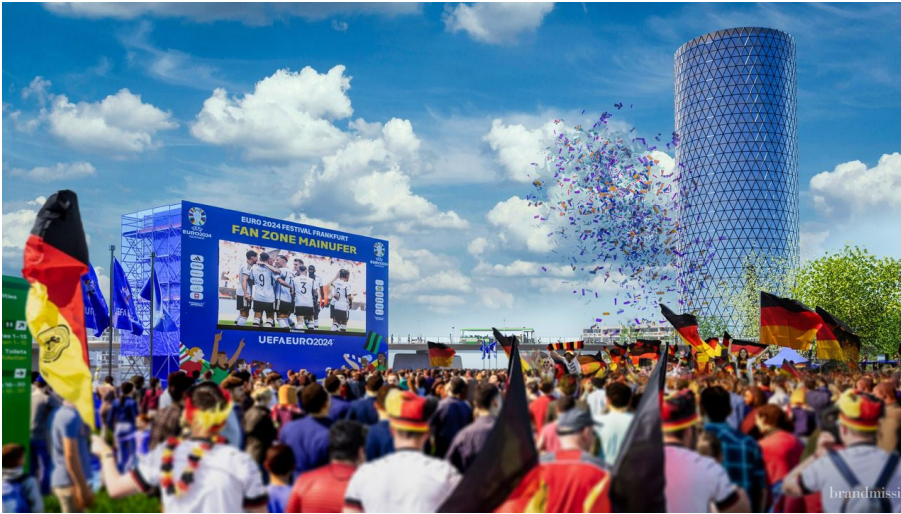
Frankfurt_Fan Zone Mainufer Big Screen und Fans_© Brandmission.jpg - © Brandmission