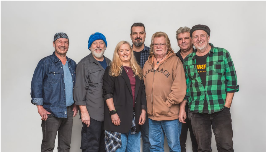
Rodgau Monotones NEU Carina Augusto(1).jpg