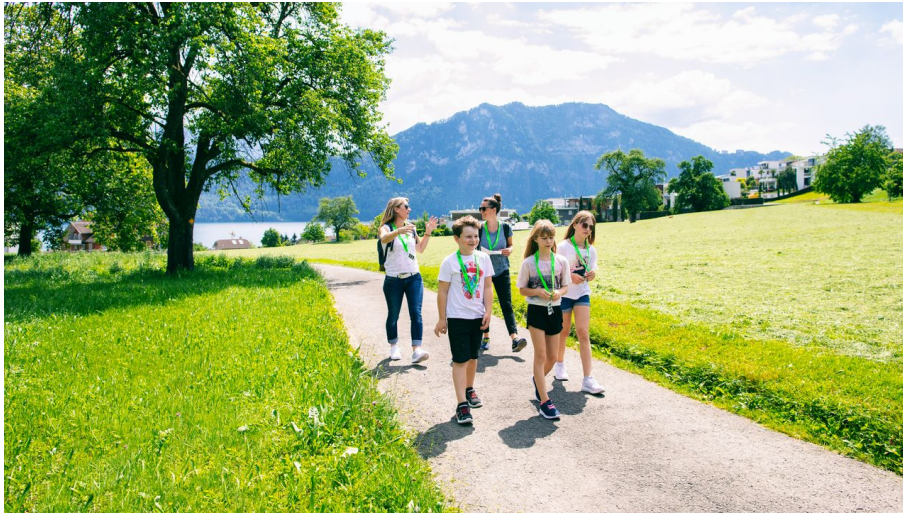
Foxtrail Helios Vitznau Weggis