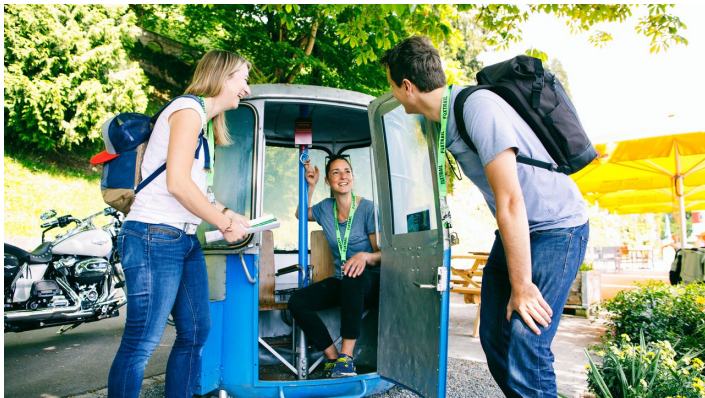
Foxtrail Helios Vitznau Weggis