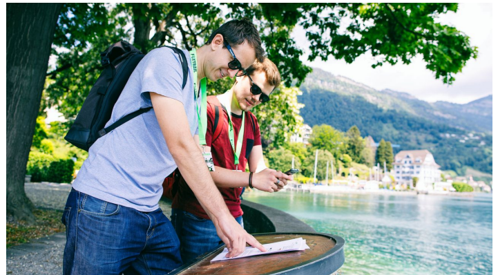
Foxtrail Helios Vitznau Weggis