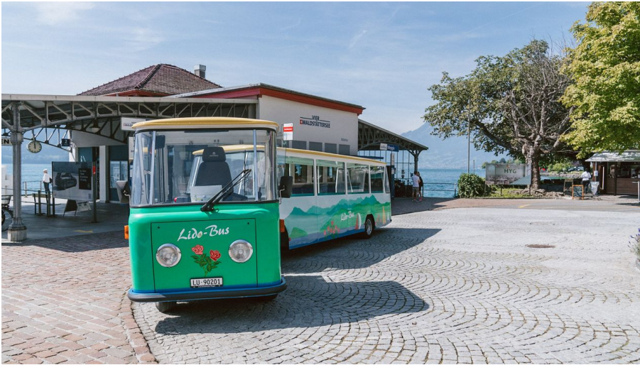
Lidobus Weggis