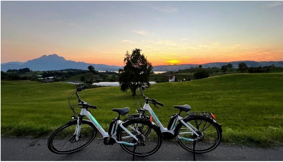
Tourist Information Weggis (Luzern Tourismus AG), Tourist Information Weggis