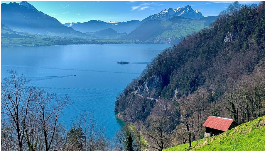
Aussicht oberhalb Rotschuo