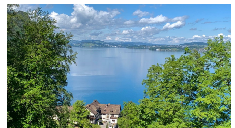
Abstieg Richtung Vitznau mit dem Hotel Flora Alpina und der gleichnamigen Bushaltestelle