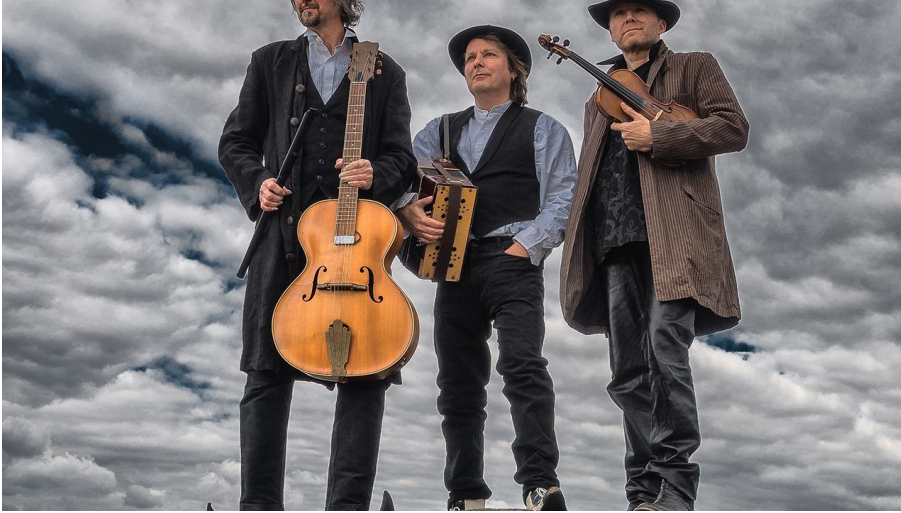
Aberlour's - Celtic Folk 'n' beat Pressefoto Trio Copyright Heiko Fiedler 2017 1.5 MB.jpg - © Fiedler, Heiko Fiedler