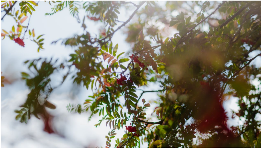
Schierker-Kuhball_WTG_Polyluuchs(74) (1).jpg