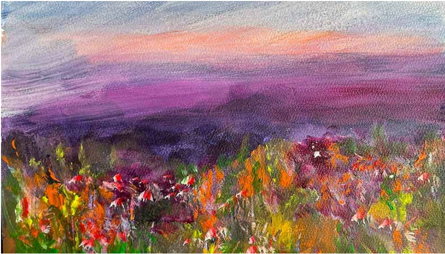
Ausstellung Frau Truskaller1.jpg