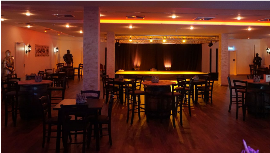
Bar Raubritter