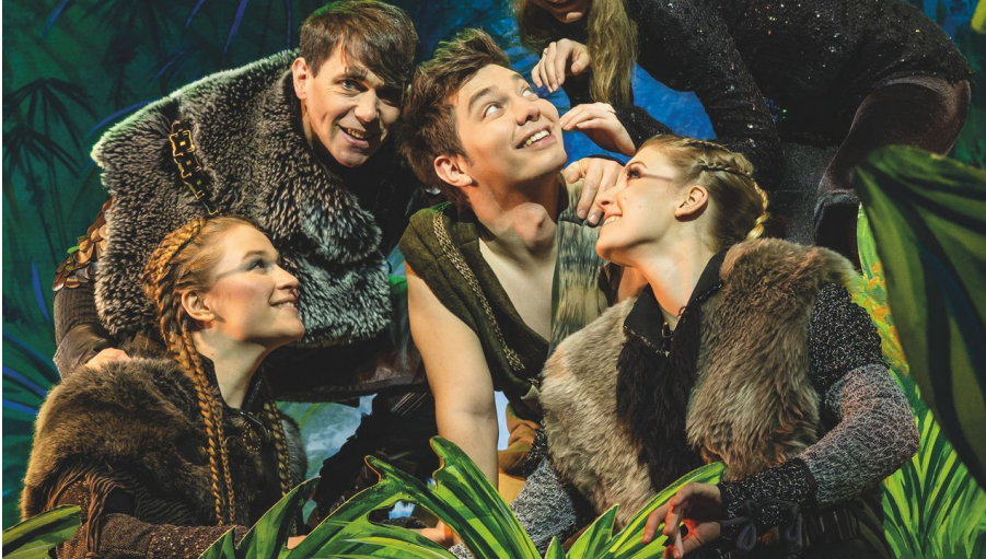
Dschungelbuch - das Musical_Pressebild 03_quadrat.jpg