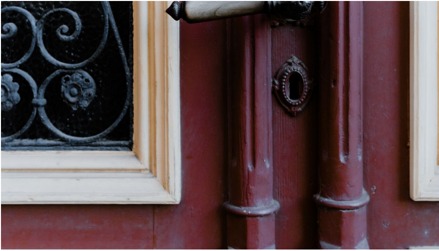
Türklinke in Wernigerode