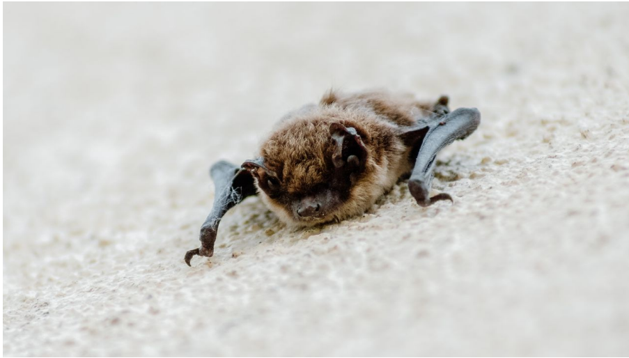
bat-3380678-2.jpg