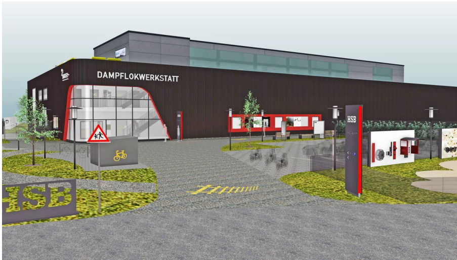
2022-01-14_AV Entwurf HSB Außengelände_komSaWei_KM.jpg