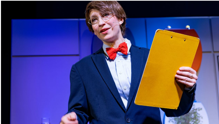
DISTEL_Im Hinterzimmer der Macht_Lux_Chris Gonz-1.jpg