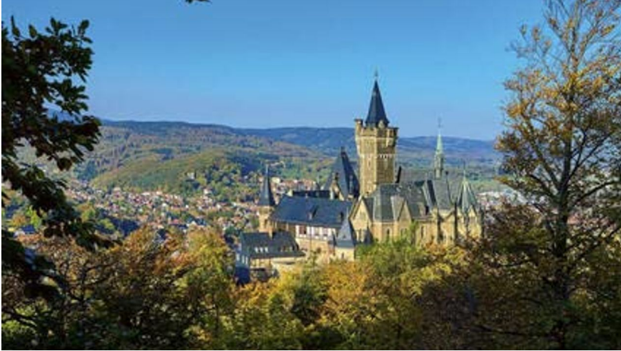
Schloss Wernigerode_Juranek_Stekovics.jpg