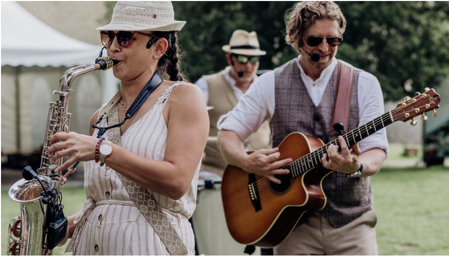
Mr Moonlight mobiles Trio mit BEATS 2024.png