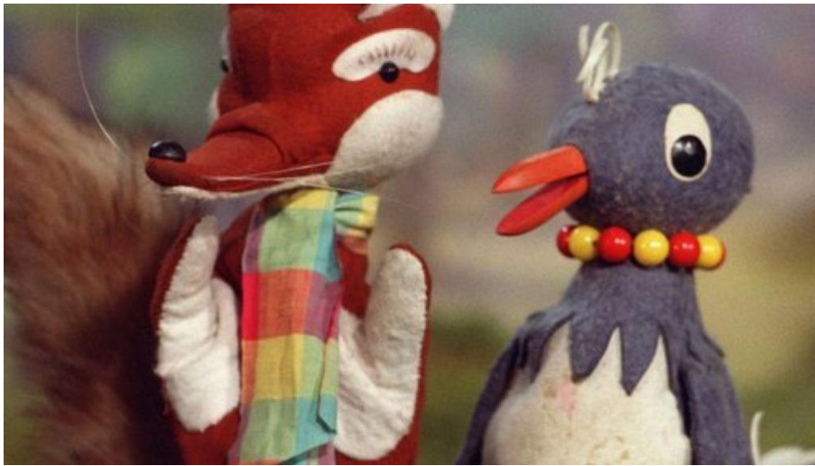
pitti-4-BM-Kultur-Berlin-jpg - © Theater Silberborn