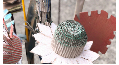
Goedecke-zeichnatelier-blume - © Dorit Goedecke