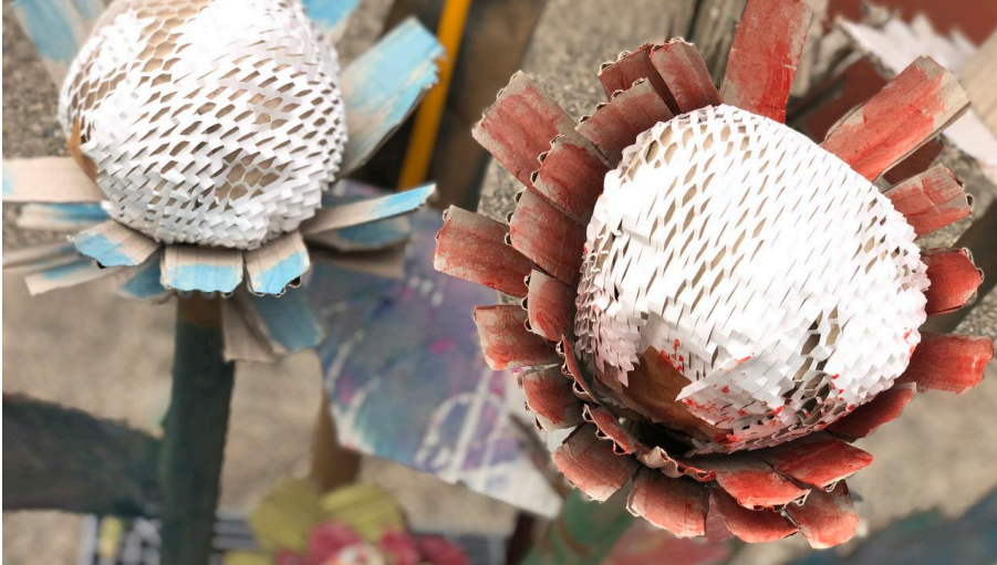
Goedecke-zeichnatelier-blumen - © Dorit Goedecke