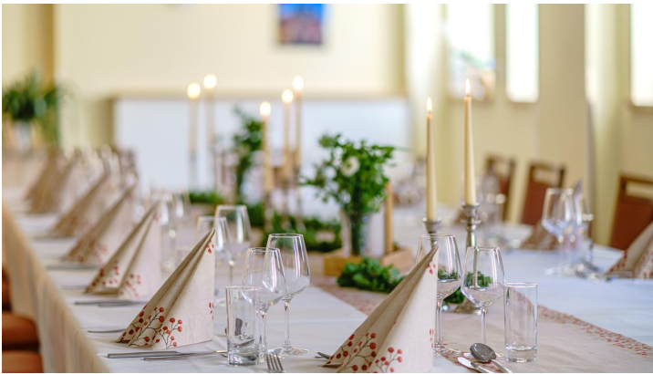
Tafel im Café