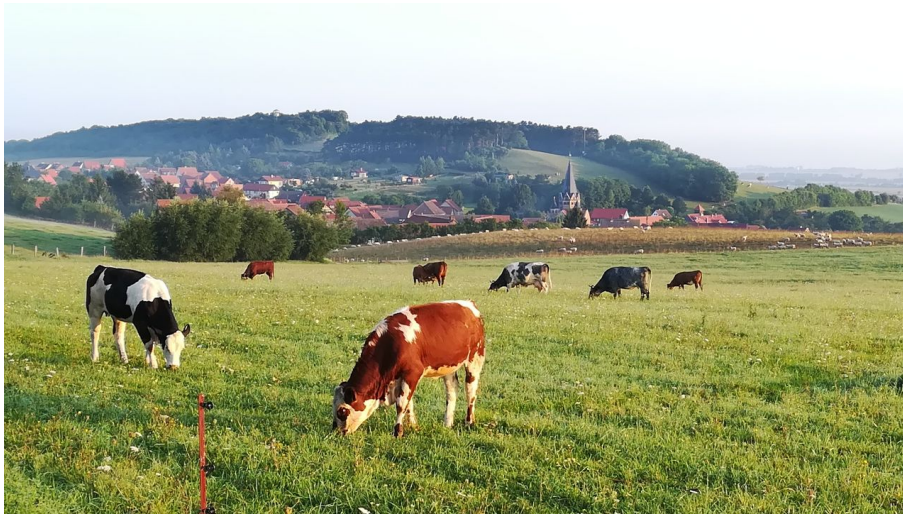
Morgenstimmung bei Benzingerode