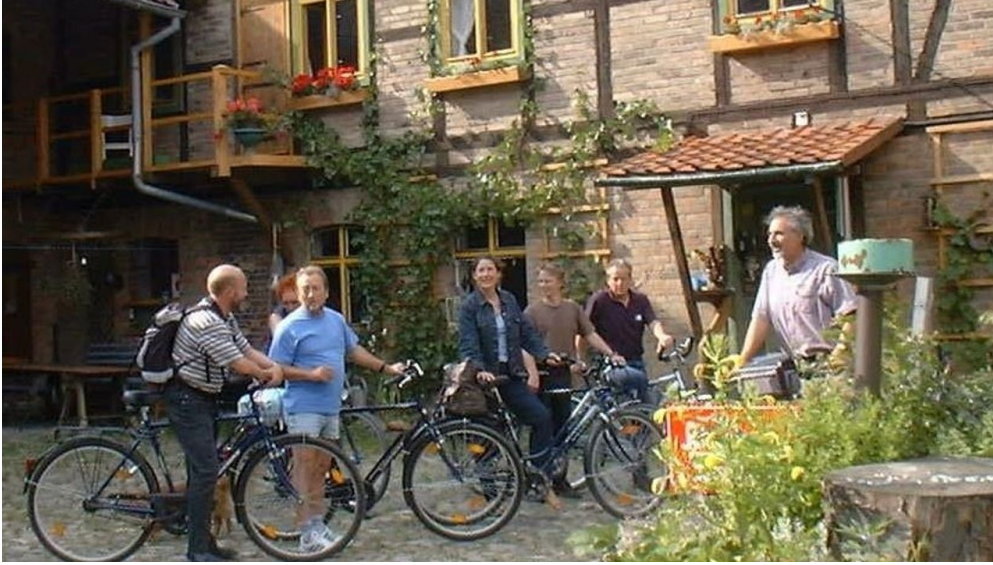
Radfahrer an der Gutsmühle in Minsleben