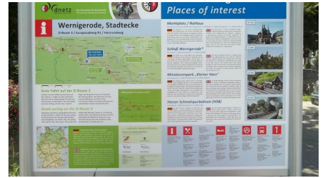
Informationstafel an der Städtecke in Wernigerode