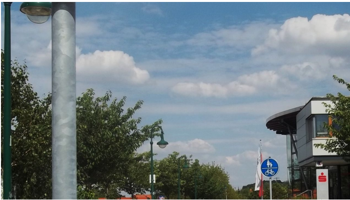
Am EDEKA-Markt in der Halberstädter Straße Wernigerode