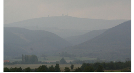
Der Brocken im Dunst aus der Nähe von Darlingerode gesehen.