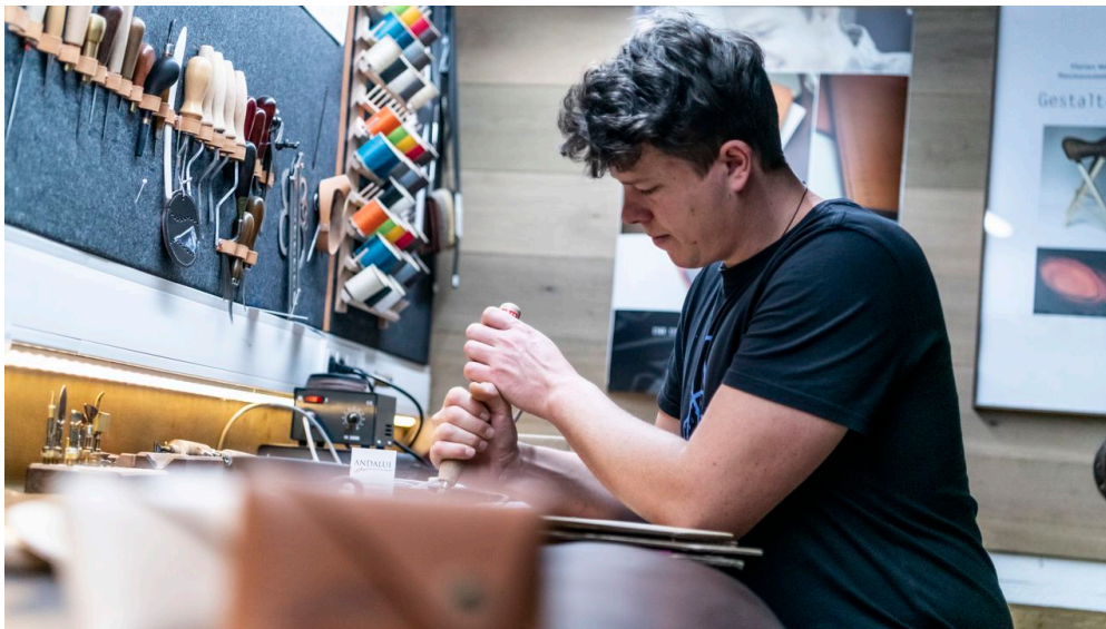
Lederverarbeitung Andalui