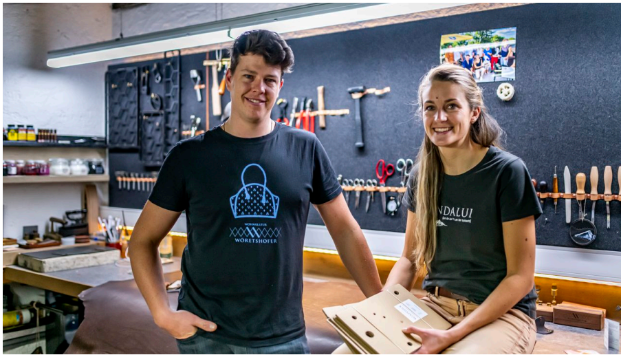
Florian Wöretshofer Lederverarbeitung Andalui