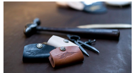
Lederverarbeitung Andalui - © Christian Stadler