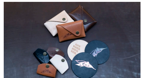
Lederverarbeitung Andalui