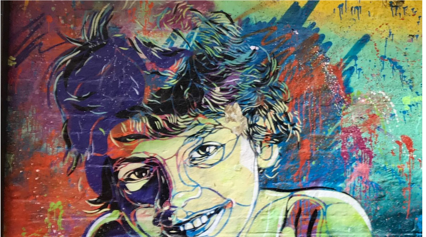
StreetArt von Kunstklamm16 - © Stephanie Kelch-Onken

Donnerstag, 01.08.2024, 10:00 - 17:00 Uhr