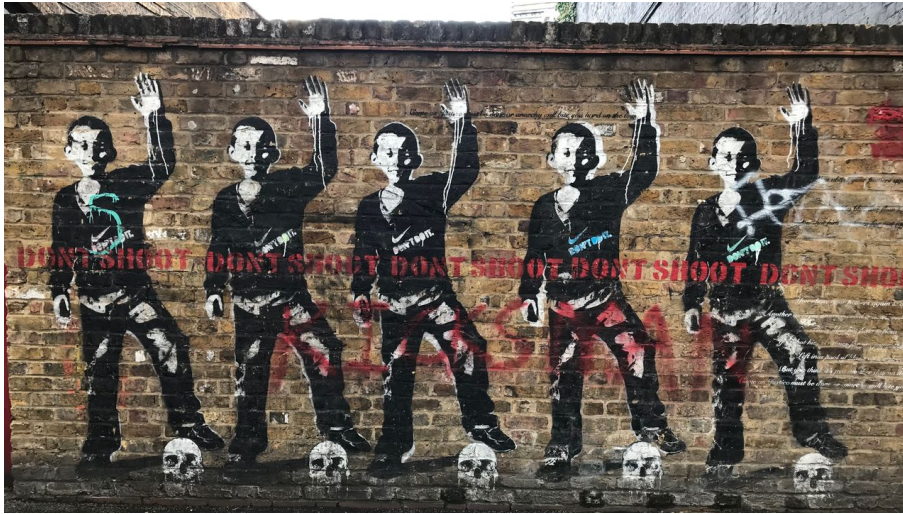
StreetArt von Kunstklamm16