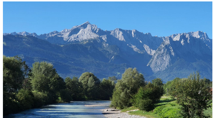
Wanderweg an der Partnach bis zur Partnachklamm