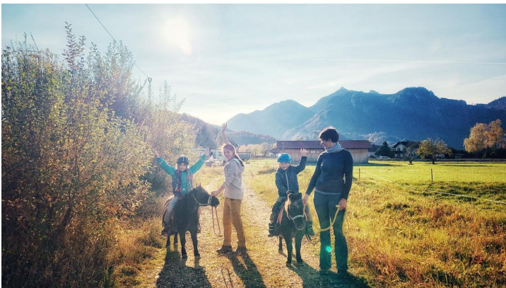
... geführtes Ponyreiten für Kinder möglich.