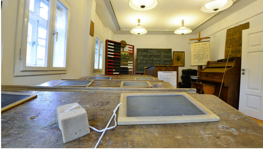
Klassenzimmer im Schulmuseum Steinhorst