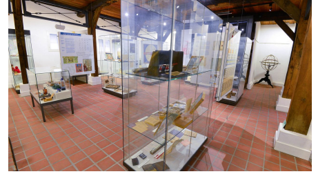
Ausstellung im Schulmuseum Steinhorst