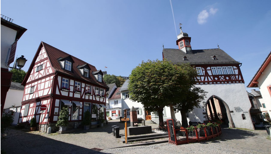
Altes Rathaus in Königstein