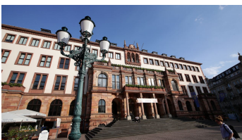
184HR - Wiesbaden - Rathaus.JPG