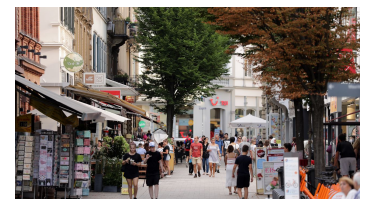
190HR - Wiesbaden - Kirchgasse.JPG - © Heiko Rhode