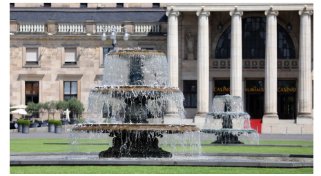
119HR - Wiesbaden - Kurhaus Bowling Green.JPG