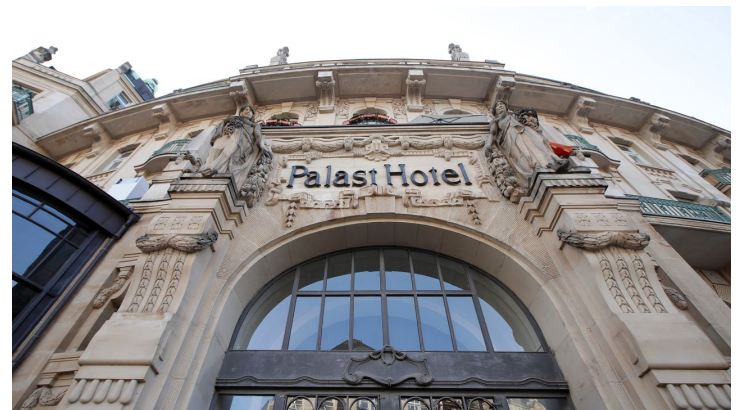
176HR - Wiesbaden - Kureck Palasthotel.JPG