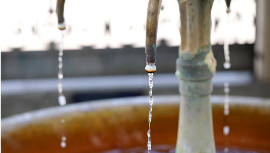
Wiesbaden - Kochbrunnen