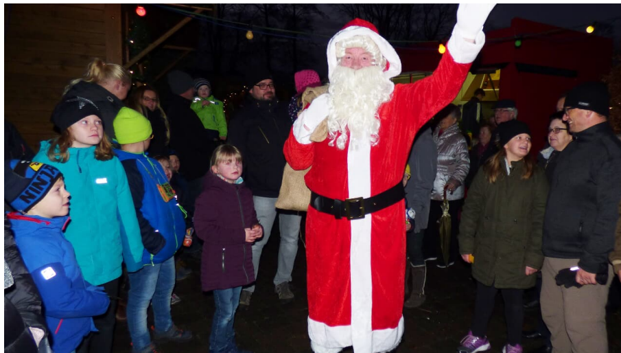
Nikolausmarkt in Vreschen-Bokel