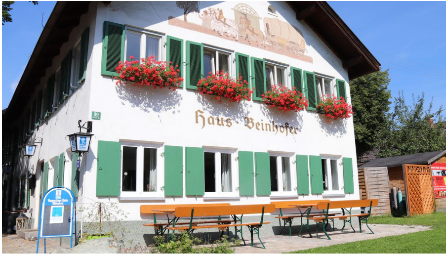
Haus Beinhofer 2.JPG