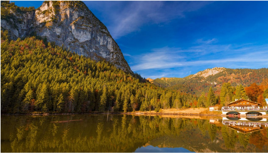
Pflgersee im Herbst - © GaPa Tourismus GmbH/Marc Hohenleitner