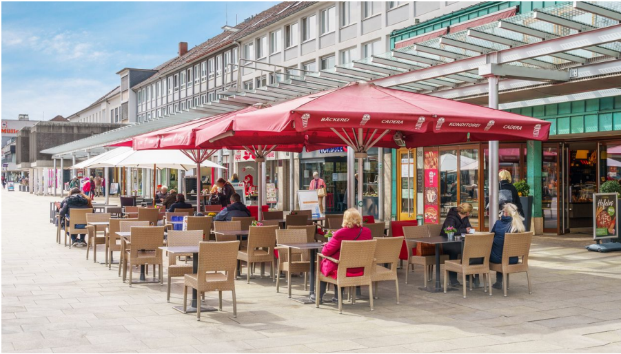
Cadera-Hauptgeschäft Porschestraße.jpg