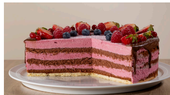
Cadera-Erdbeer-Sahne-Torte.jpg - © Martina Sandkuehler