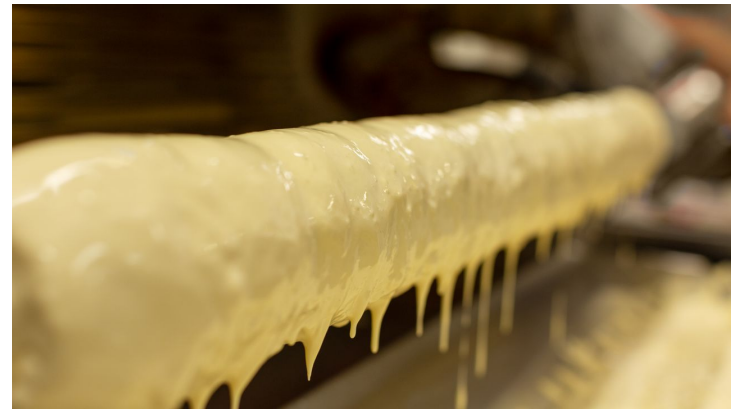
Baumkuchen-Backen.jpg - © Martina Sandkühler