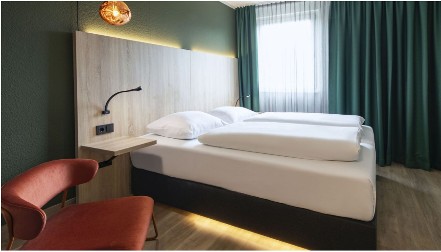
Business Doppelzimmer im ACHAT Hotel Monheim am Rhein