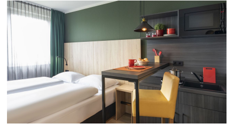
Apartment im ACHAT Hotel Monheim am Rhein