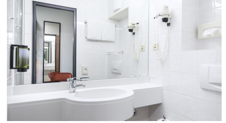
Badezimmer im ACHAT Hotel Monheim am Rhein