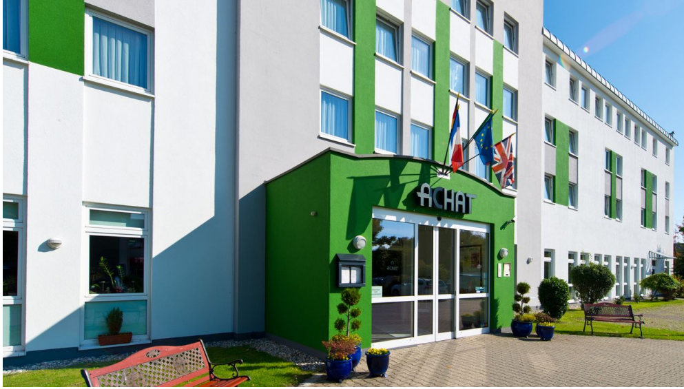
ACHAT Hotel in Monheim am Rhein