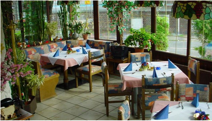
Hotel-Restaurant Zur Kastanie