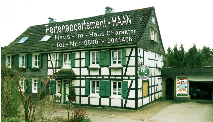
Ferienappartement Haan