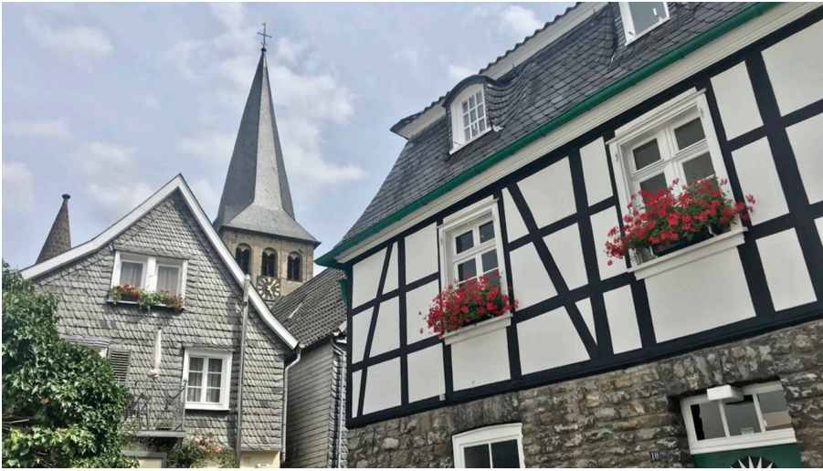
Altstadt von Mettmann nahe des Wohnmobilstellplatzes an der Schwarzbachstraße