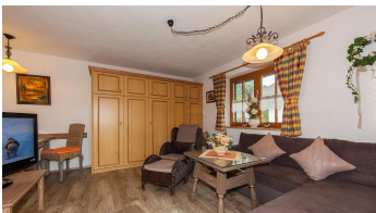
Fewo Nr. 1, Wohnraum