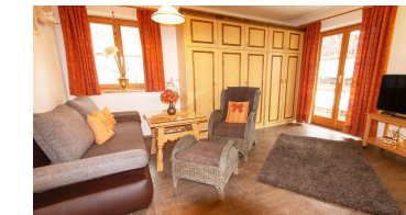
Fewo Nr. 2, Wohnraum