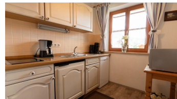
Fewo Nr. 1, Küche