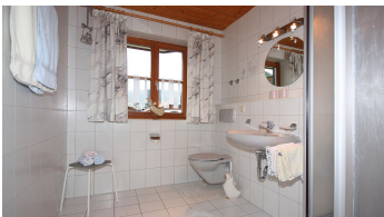
Fewo Nr. 1, Dusche/WC