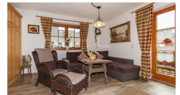
Fewo Nr. 1, Wohnraum