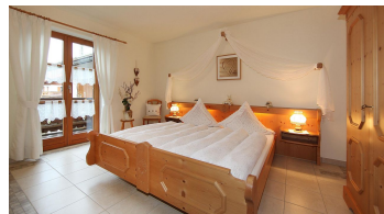
Fewo Nr. 1, Schlafzimmer