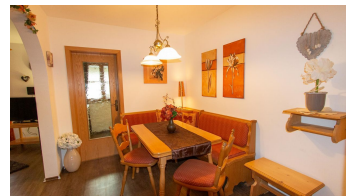
Fewo Nr. 2, Wohnraum