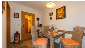
Fewo Nr. 1, Wohnraum