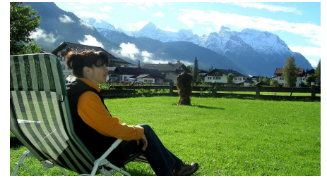
Erholung in unserem Garten