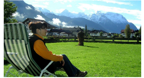
Erholung in unserem Garten