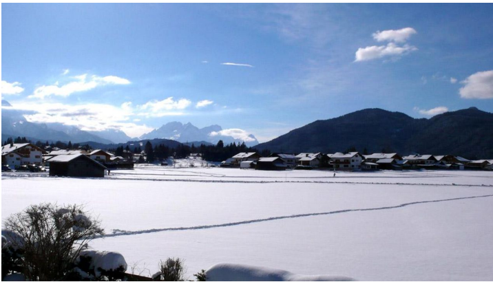
Langlaufen im Winter in Krün