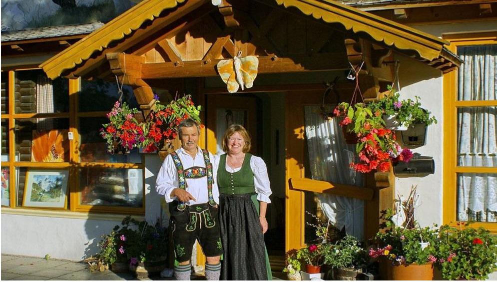
Herzlich Willkommen !