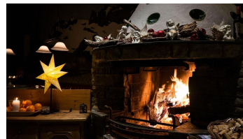
Kaminfeuer - warm und kuschelig