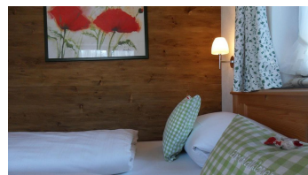
Schlafzimmer im Komfortzimmer