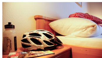
Bike und Bed ;) - ohne Worte