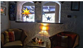
Sitzecke vor der Rezeption