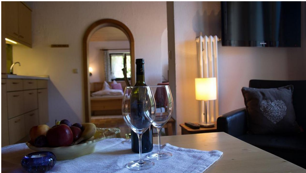
Komfort und Familienzimmer Rusticana