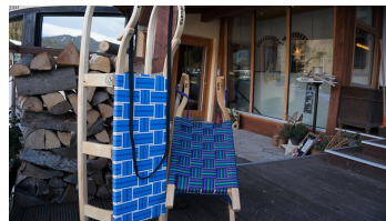
kostenlose Schlitten und Zipfelbobs