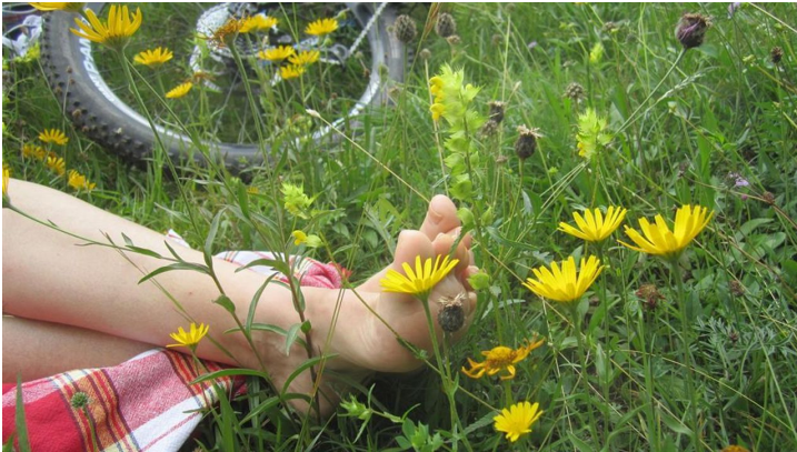
Sommer - Seele baumeln lassen