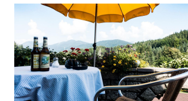
Terrasse Rusticana