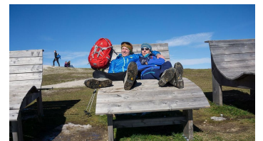
Wandern - Auszeit am Wank