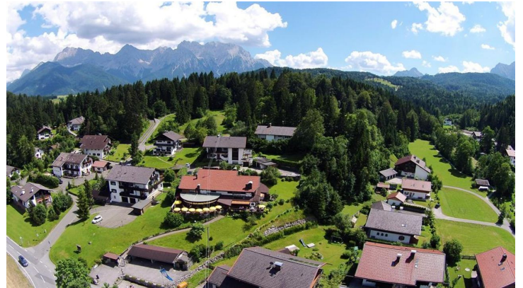
Rusticana aus der Vogelperspektive