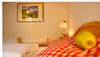
Gästezimmer - einfach ausspannen