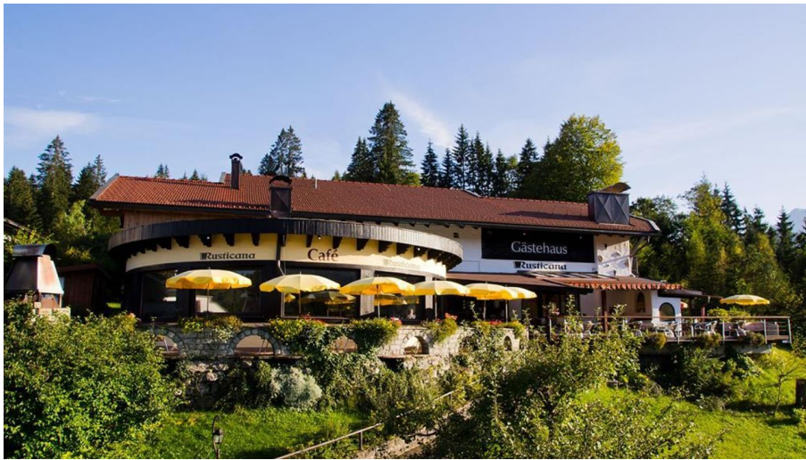
Gästehaus Rusticana mit Panoramaterrasse