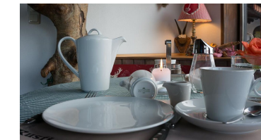
Frühstück - vielfältig und gut