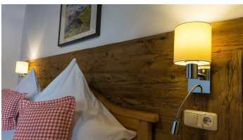
Gästezimmer - zum wohl fühlen - © websinn.com