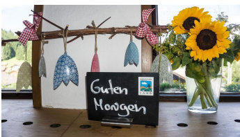
Guten Morgen - habt's einen schönen Tag!