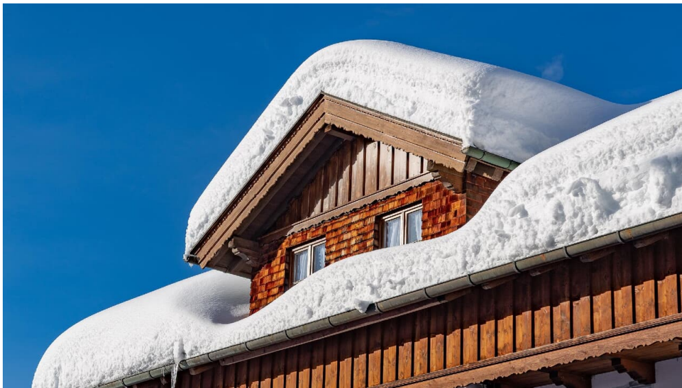
Haus Ferienwohnungen Ferienglück Krün im Winter