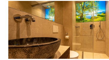
Badezimmer Ferienwohnung Skihaserl