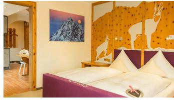
Schlafzimmer Ferienwohnung Wildfang