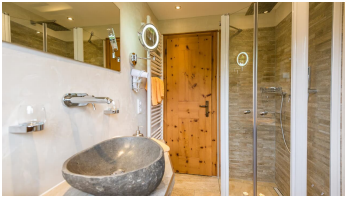
Badezimmer Ferienwohnung Freiwild