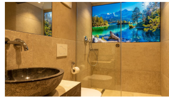
Badezimmer Ferienwohnung Adlerhorst