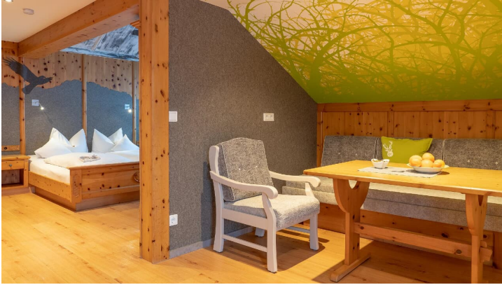
Wohnraum Ferienwohnung Adlerhorst