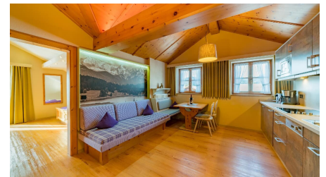
Wohnraum Ferienwohnung Gipfelglück