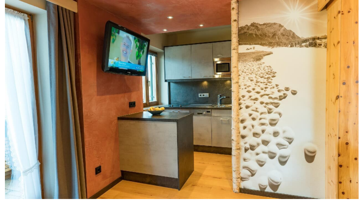
Küche Ferienwohnung Skihaserl