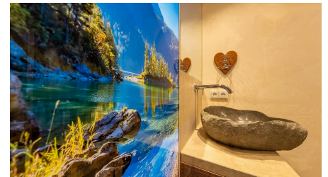
Badzimmer Ferienwohnung Bergfex