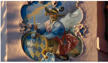
Lüftmalerei am Erker Ferienwohnungen Feringlück