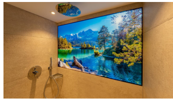
Badezimmer Ferienwohnung Adlerhorst