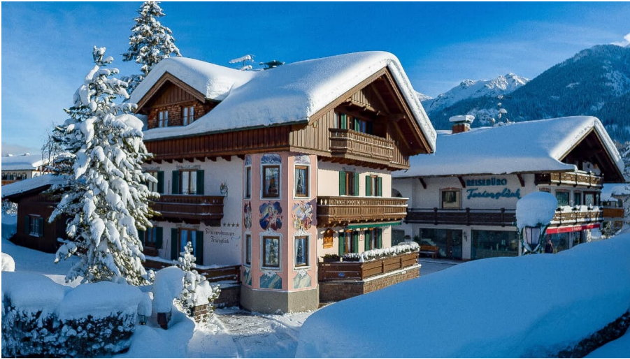
Haus Ferienwohnungen Ferienglück Krün im Winter