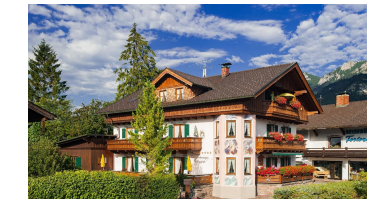
Haus Ferienwohnungen Feringlück in Krün