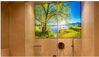
Badezimmer Ferienwohnung Skihaserl