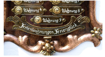
Klingelschild Ferienwohnungen Feringlück Krün - © Ferienwohnungen Feringlück Krün, Martin Kriner