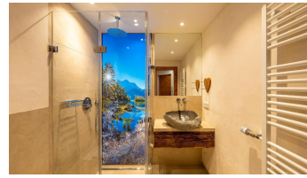
Badezimmer Ferienwohnung Bergfex