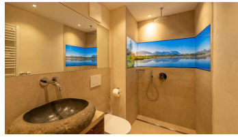
Badezimmer Fewo Heublume