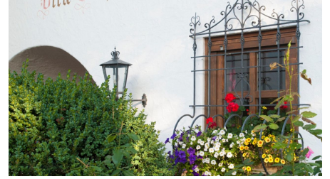
Herzlich Willkommen Dahoam