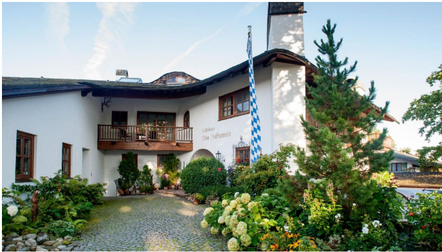
Die Vita Stafnensis