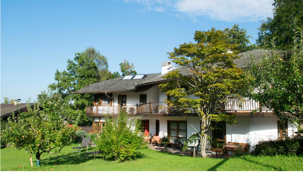
Apart Pension Vita Stafnensis