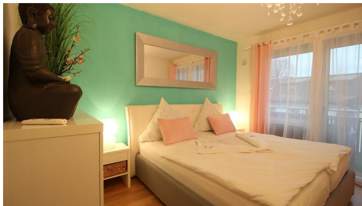
PEARL ROYALE SZ