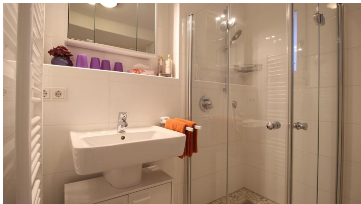
PEARL ROYALE Bad