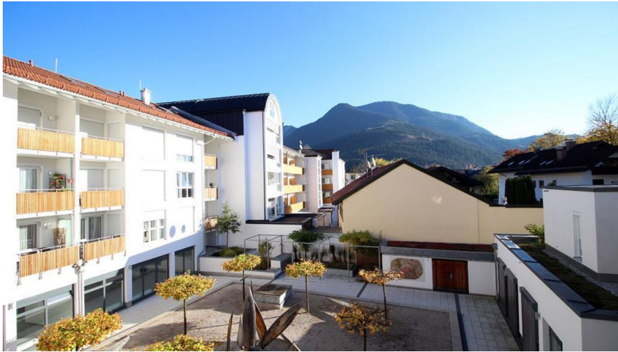
PEARL ROYALE Anwesen