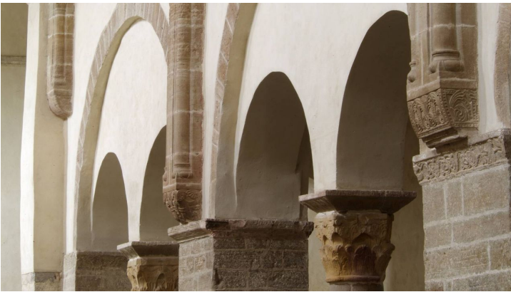
Evangelisches Zentrum Kloster Drübeck - Kirche St. Vitus