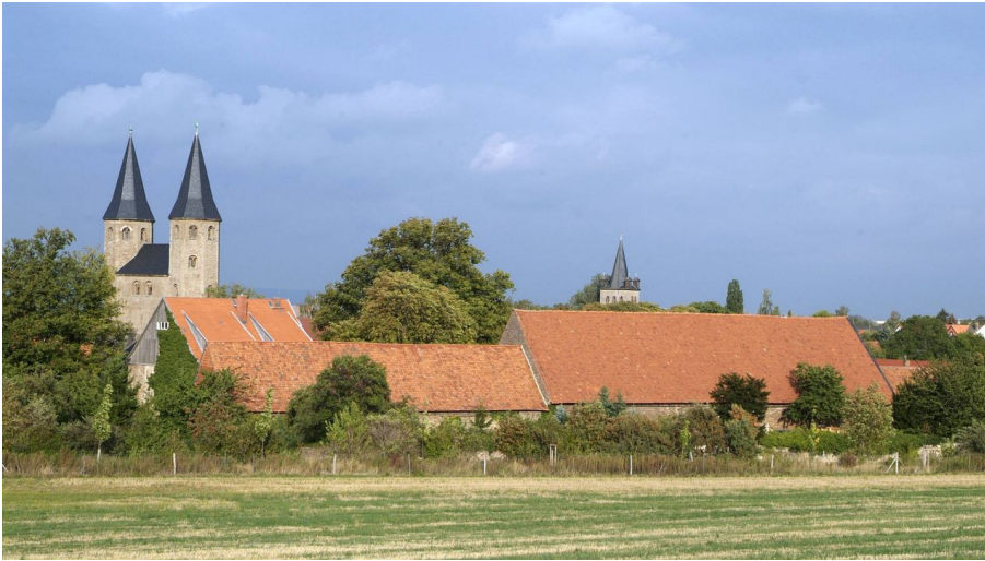
Evangelisches Zentrum Kloster Drübeck