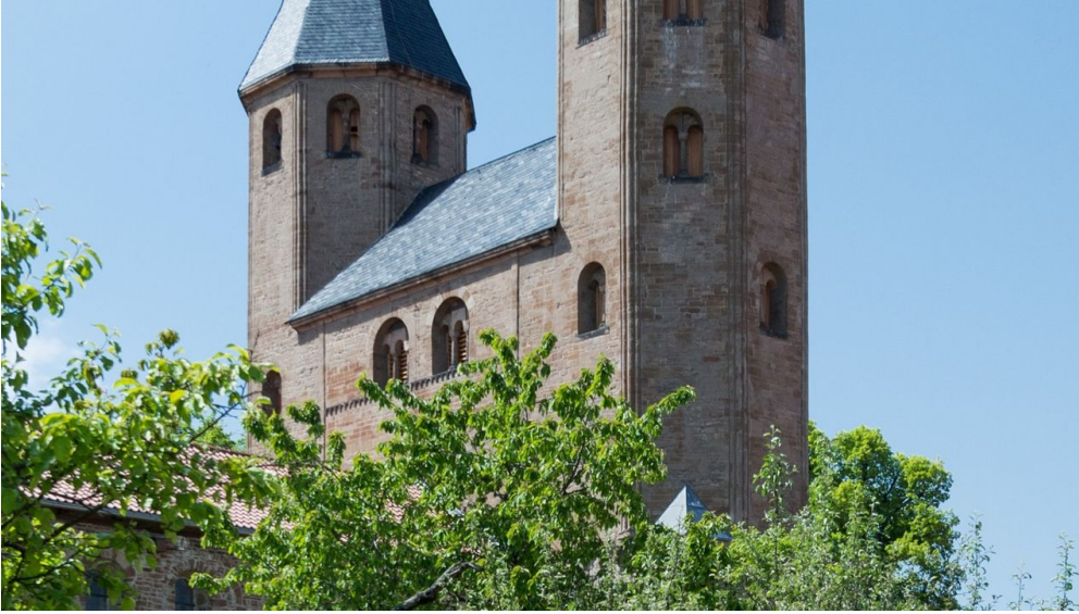
Evangelisches Zentrum Kloster Drübeck