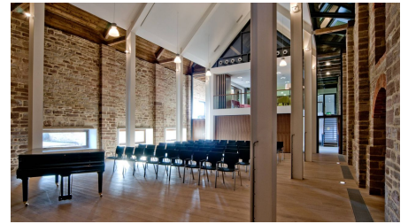
Evangelisches Zentrum Kloster Drübeck - Adelbrinsaal - © Kloster Drübeck - Foto: Ulrich Schrader