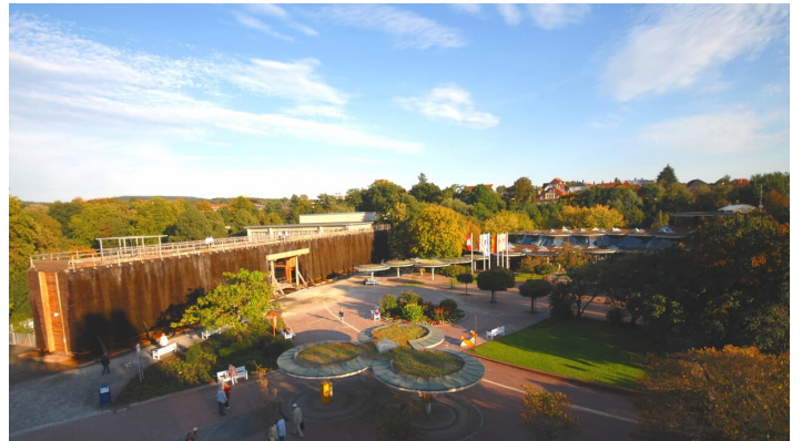
Erlebnisgradierwerk in Bad Salzuflen