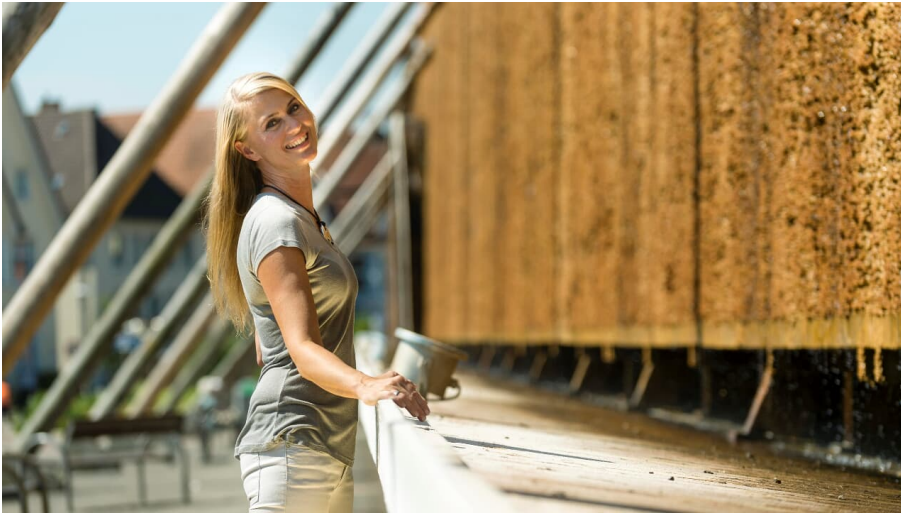
Tief durchatmen am Gradierwerk